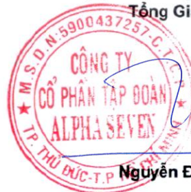
Nguyễn Đình Trạc